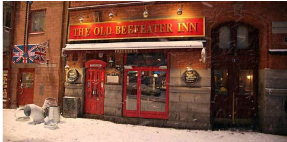
Old Beefeater Inn i Göteborg