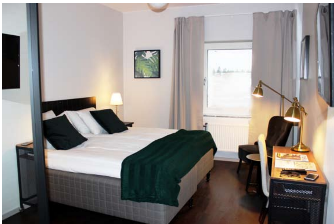
Hotellrum Rasta Värnamo

Kolumnen avstämning avser moderbolaget, koncernjusteringar, koncernelimineringar och transaktioner på bolagsnivå som inte ingår i själva rörelsesegmenten. Till största delen består kolumnen av omklassificering till finansiell lease.