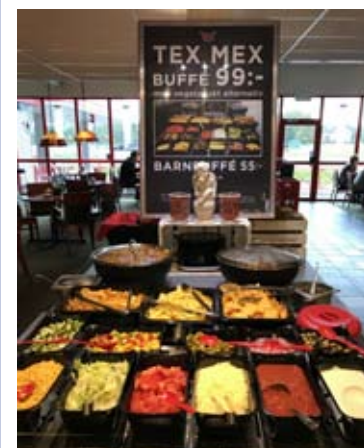
Tex Mex på Rasta