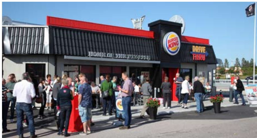
Burger King på Rasta Brälanda