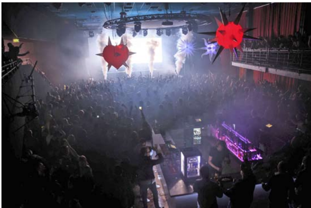
Nattklubben Enter på Restaurang Trädgår'n i Göteborg

Kolumnen avstämning avser moderbolaget, koncernjusteringar, koncernelimineringar och transaktioner på bolagsnivå som inte ingår i själva rörelsesegmenten. Till största delen består kolumnen av omklassificering till finansiell lease.