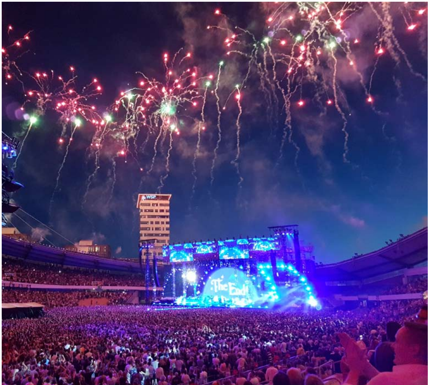
Slutscen Håkan Hellström konsert juni 2016