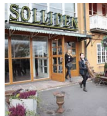
Solliden på Skansen i Stockholm