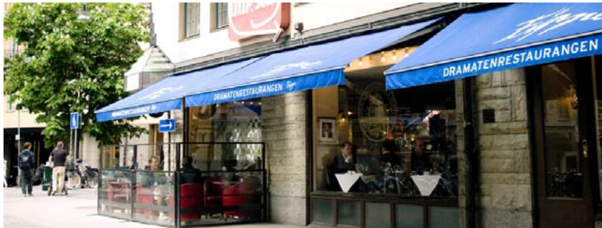
Restaurang Fripes, en del av Dramatens restauranger