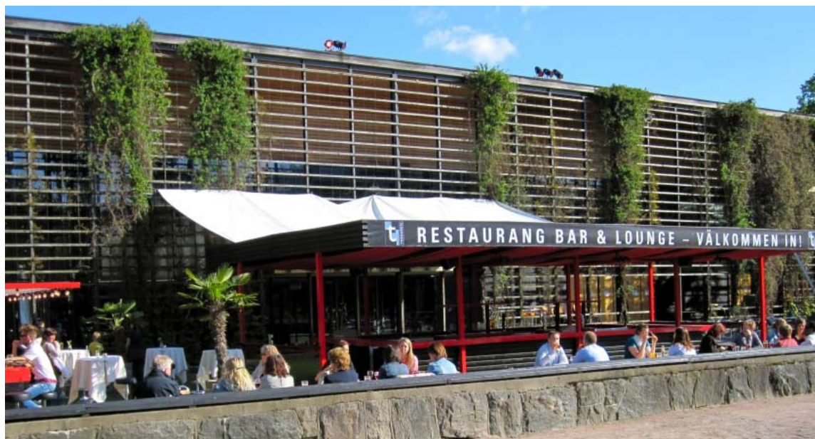
Uteservering på Restaurang Trädgår'n

Hotellverksamheten är avvecklad per 2 juni 2014. Koncernföretaget som äger hotellfastigheten i Göteborg är avyttrad 11 juli 2014.