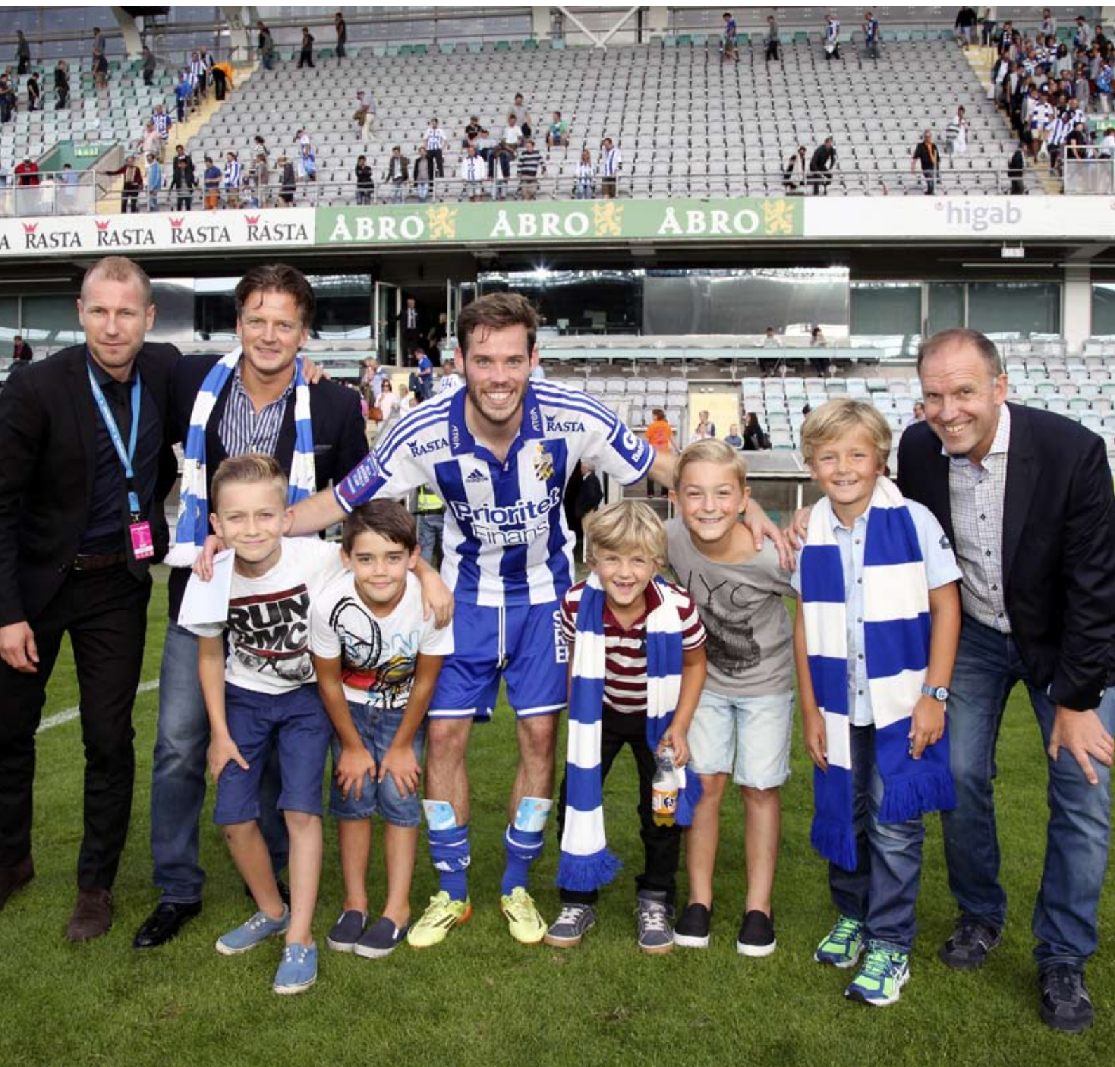
Rasta ny huvudsponsor till IFK Göteborg