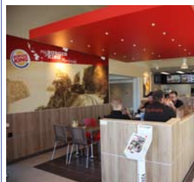
Burger King på Rasta BHäby