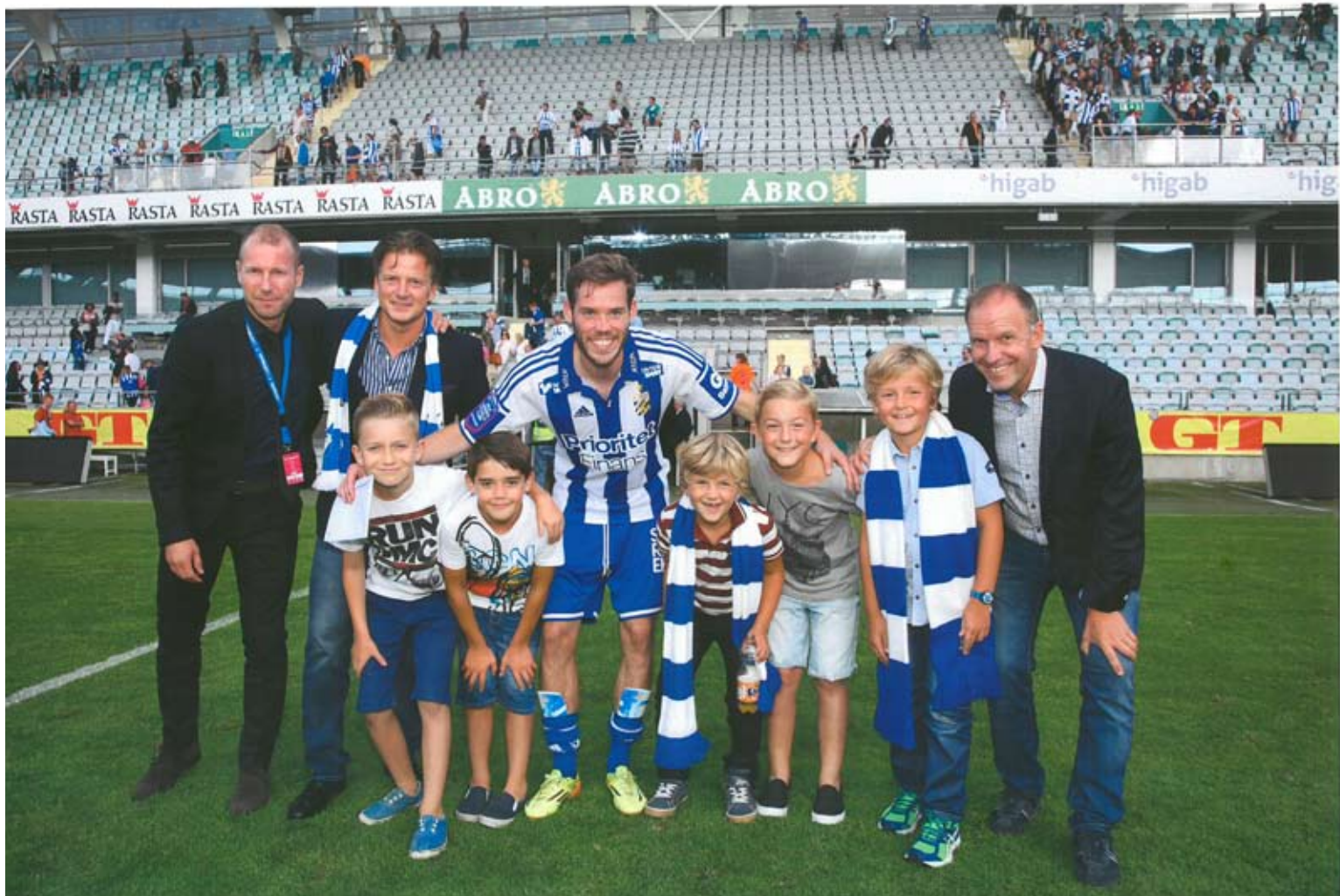
Rasta stolt sponsor till IFK Göteborg