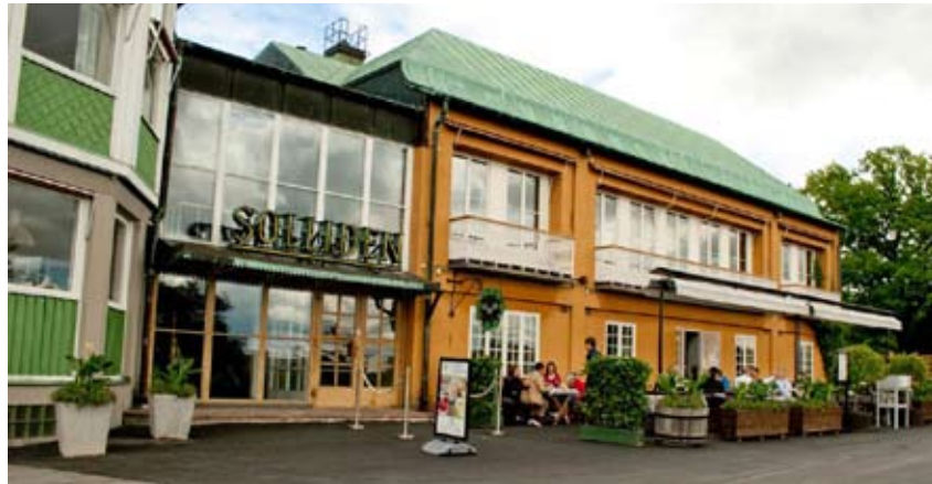
Restaurang Solliden på Skansen