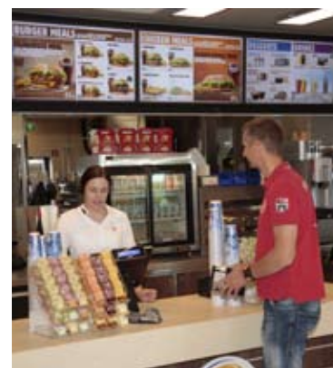
Burger King på Rasta Brålanda