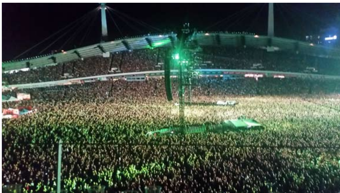
Publikkhav vid Metallica-konsert på Ullevi i augusti

I avstämningskolumnen ingår en engångsersättning/investeringsbidrag om 0 (7 113) Tkr i samband med övertag av hotellverksamheten i Malmö per 1 januari 2011. Motsvarande post ingår även i kolumnen Hotell avvecklad verksamhet.