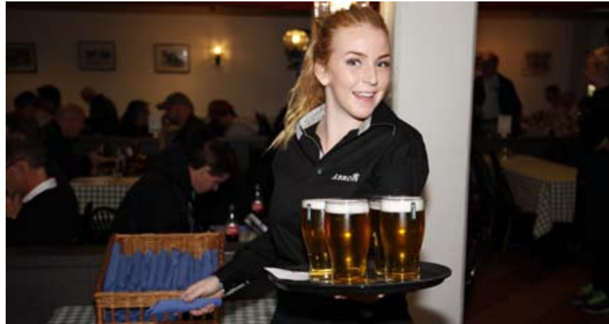
Olympiatravet på Åby Travbana