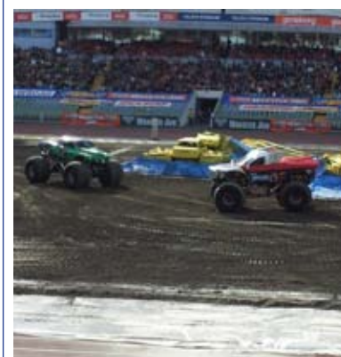
Monster Jam på Ullevi