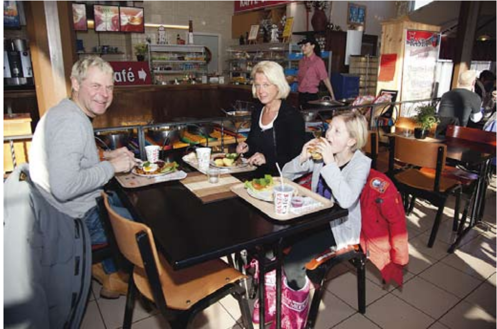
Familj äter på Rasta Tanum