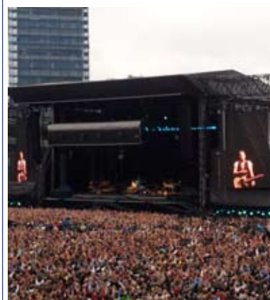
Bruce Springsteen på Ullevi