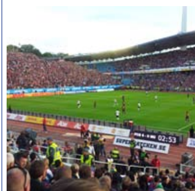
Barcelona - Manchester United på Ullevi