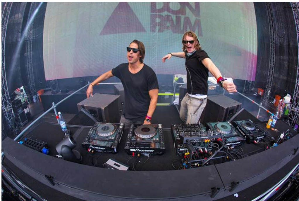
DonPalm spelar på Summerburst på Ullevi