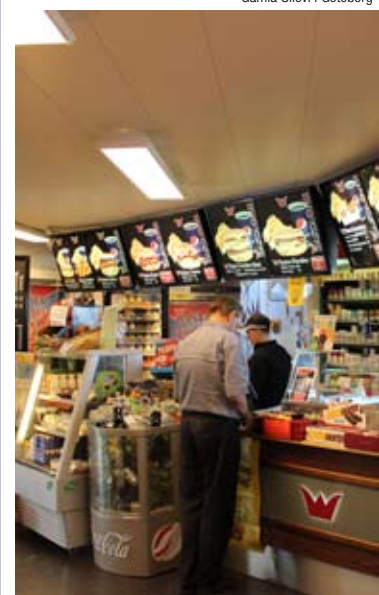
Butik Rasta Ödeshög