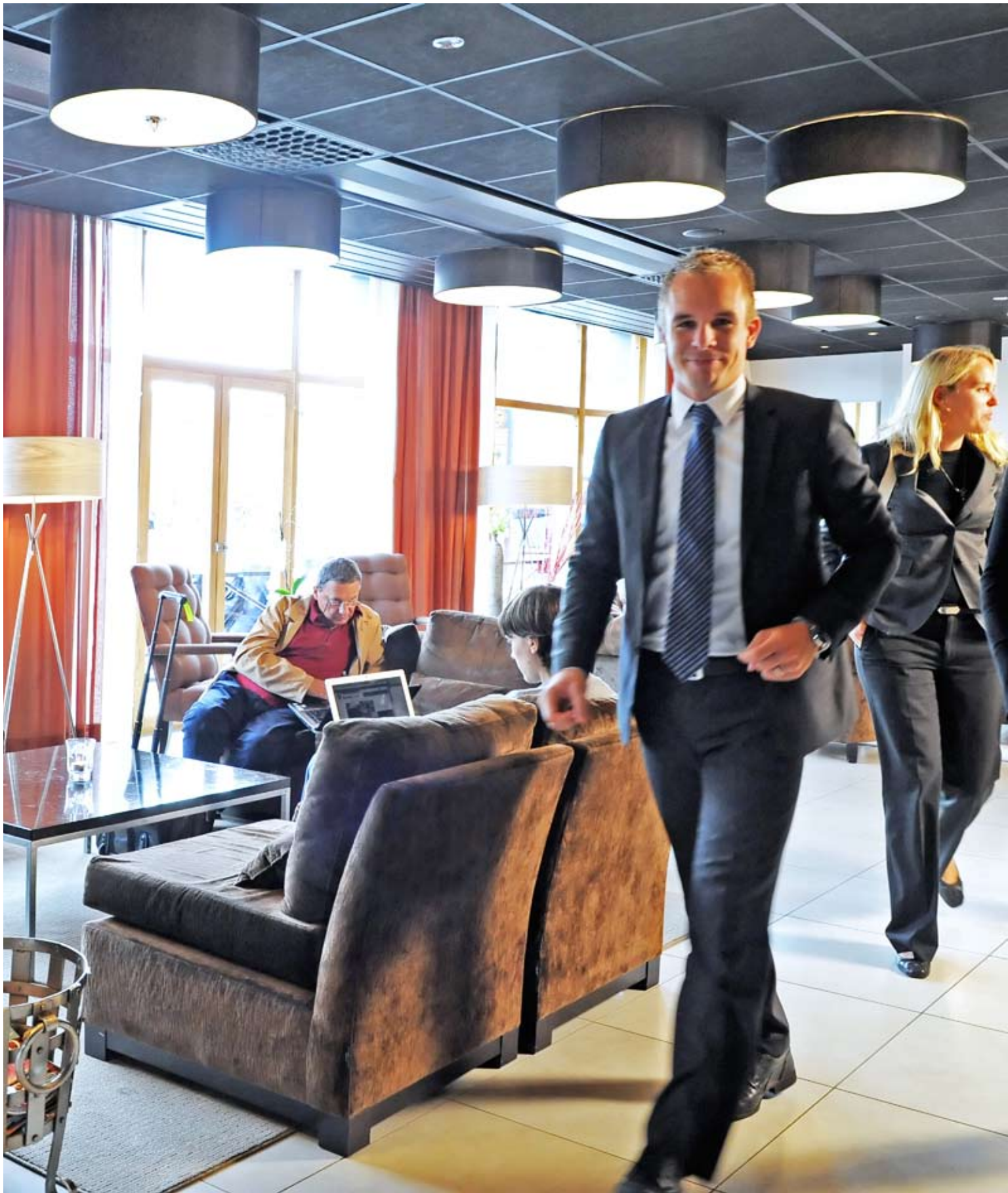
Lobby Grand Hotel Opera