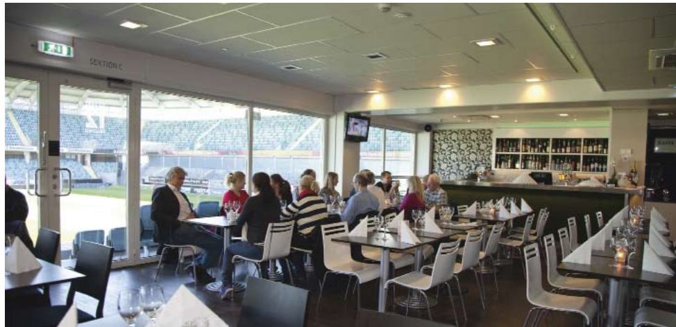
Restaurang 12:an på Gamla Ullevi