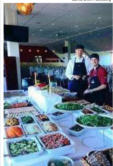
Buffé på Guldfågeln Arena