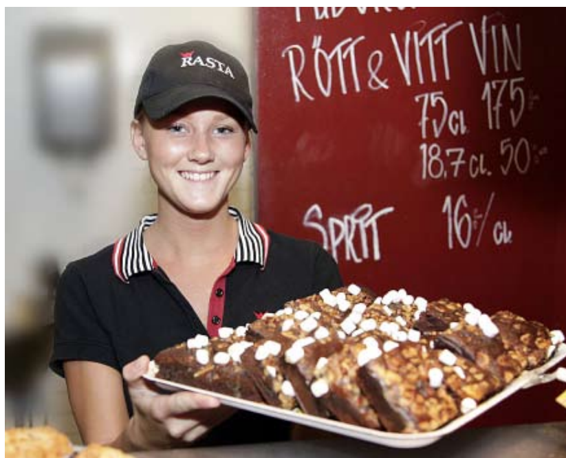
Servitris på Rasta Kalmar

I avstämningskolumnen ingår en engångsersättning/investeringsbidrag om 407 (407) Tkr i samband med övertag av hotellverksamheten i Malmö per 1 januari 2011. Inga ytterligare åtaganden föreligger, varför intäkt redovisas.