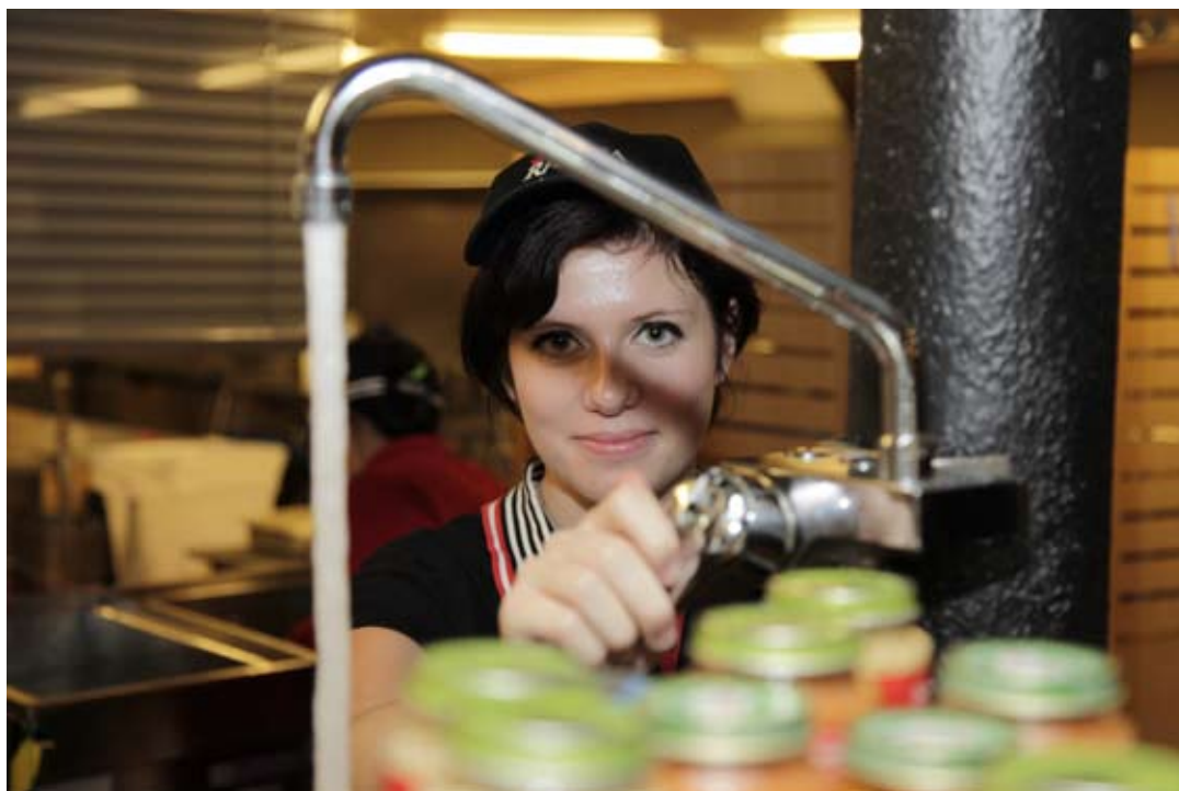
Servitris på en Rasta serviceanläggning

I avstämningskolumnen ingår en engångsersättning/investeringsbidrag om 407 (407) Tkr i samband med övertag av hotellverksamheten i Malmö per 1 januari 2011. Inga ytterligare åtaganden föreligger, varför intäkt redovisas.