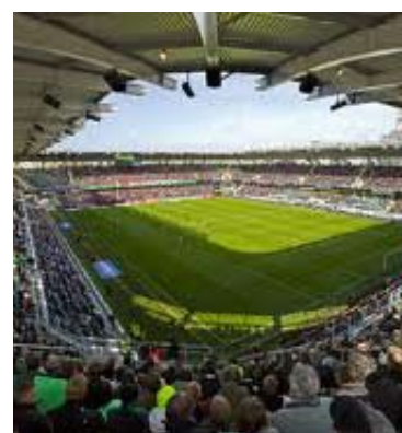
Gamla Ullevi i Göteborg