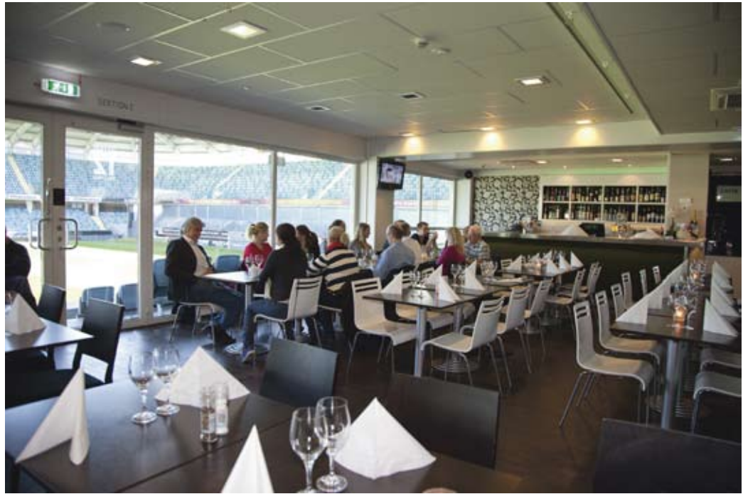
Lunch på Gamla Ullevi