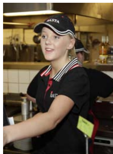
Servitris Rasta Ulricehamn