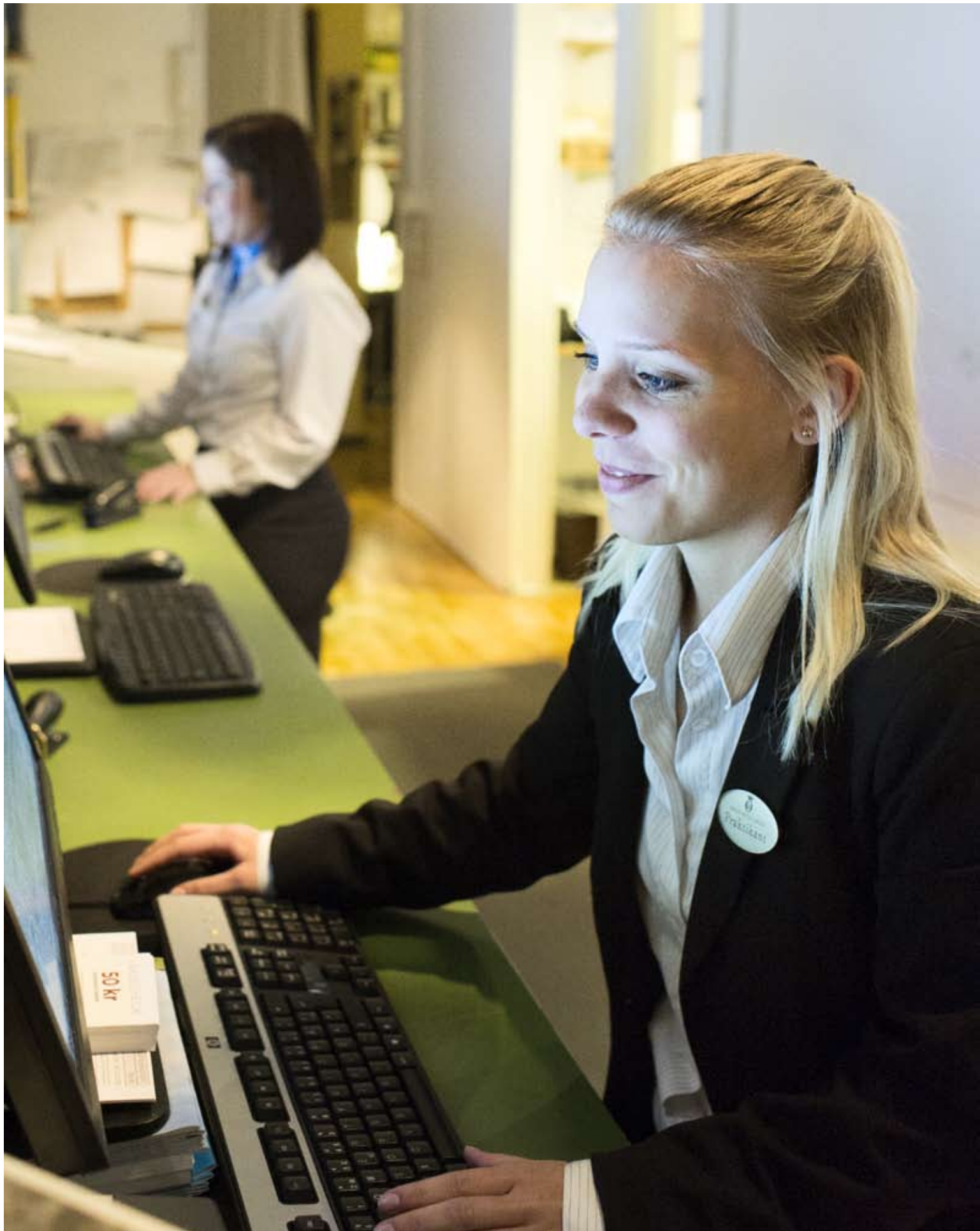
Reception Grand Hotel Garden