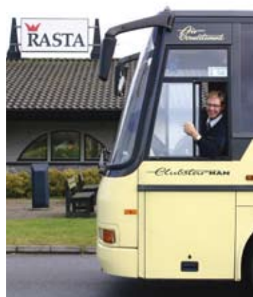
Buss vid Rasta Vårgårda