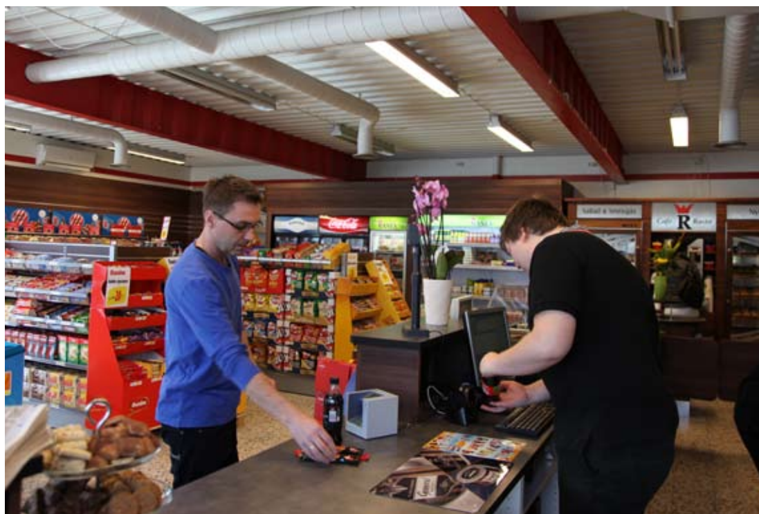
Nya servicebutiken i Arboga

I avstämningskolumnen för 2012 ingår en engångsersättning/investeringsbidrag om 407 (8 000) Tkr i samband med övertag av hotellverksamheten i Malmö per 1 januari 2011. Inga ytterligare åtaganden föreligger, varför intäkt redovisas.