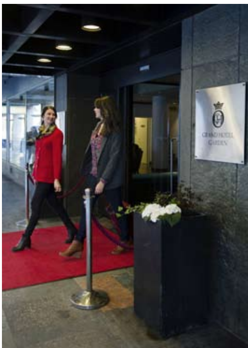
Entré Grand Hotel Garden

visningen. De nyheter som trätt ikraft och gäller för räkenskapsåret 2012 har inte haft någon effekt på koncernens finansiella rapporter. Moderbolaget tillämpar samma värderings- och redovisningsprinciper som i den senaste avlämnade årsredovisningen.