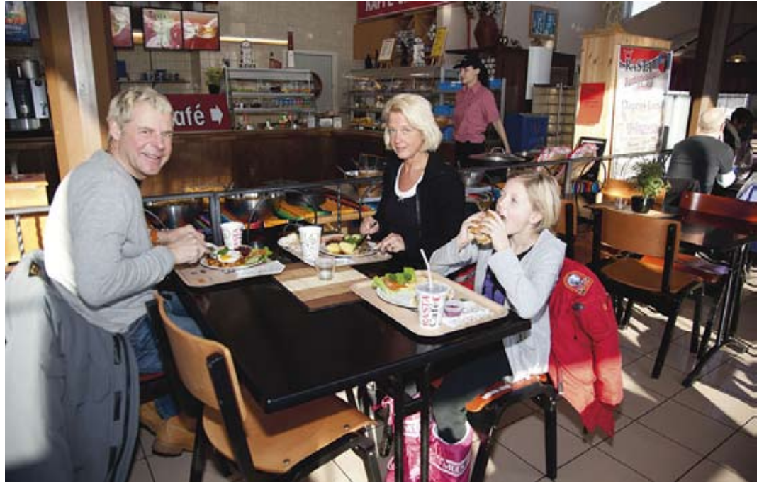
Lunch på Rasta