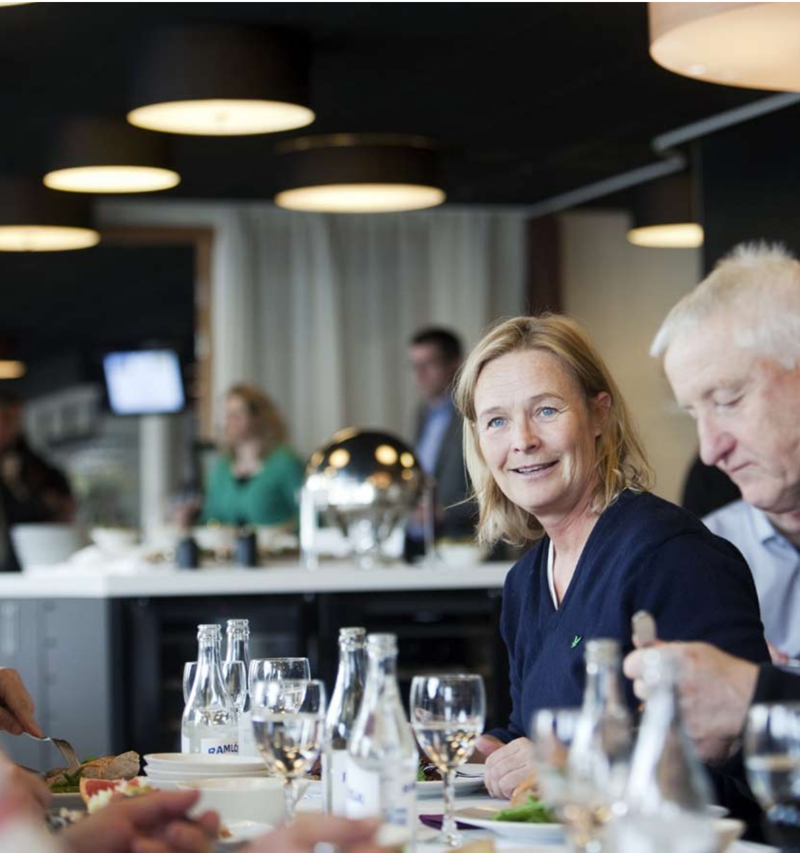
Restaurang Grand Hotel Opera