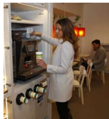
Fika på Rasta Stigs Center i Göteborg