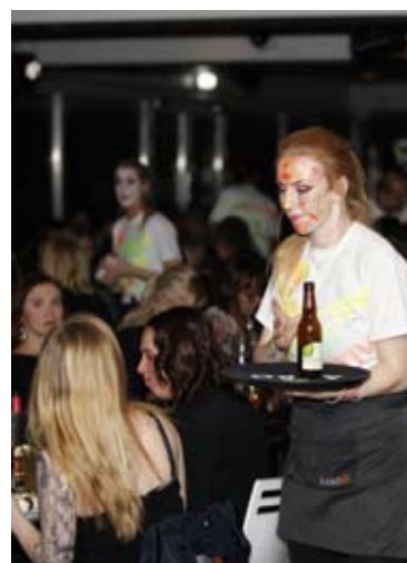
Julshow på Gamla Ullevi 2014