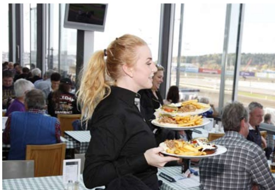
Servitris på Åby Travbana i Mölndal

I avstämningskolumnen ingår en engångsersättning/investeringsbidrag om 0 (407) Tkr i samband med övertag av hotellverksamheten i Malmö per 1 januari 2011. Motsvarande post ingår även i kolumnen Hotell avvecklad verksamhet.