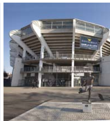
Gamla Ullevi i Göteborg