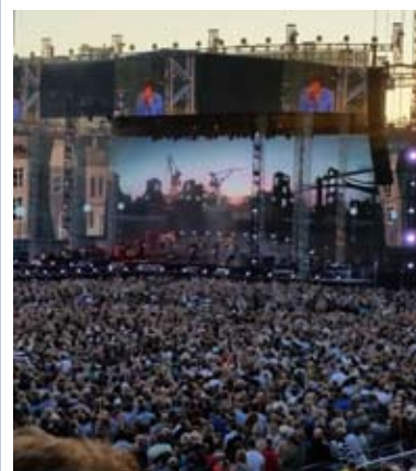
Håkan Hellström Ullevi 2014