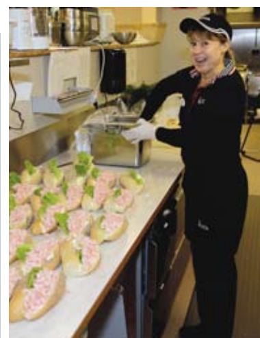
Räksmörgåsar på Rasta Tönnebro