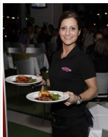
Servitris på showen på Ullevi Lounge