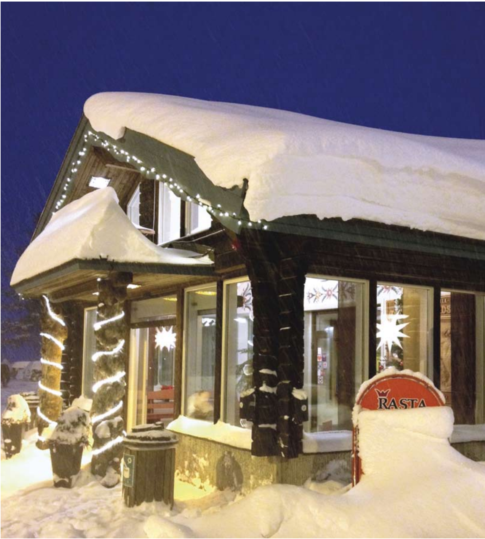
Rasta Tönnebro december 2012