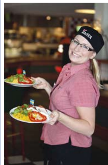
Servitris Rasta Ulricehamn