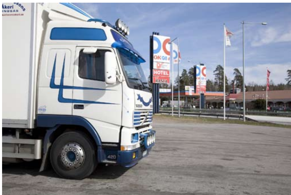
Lastbil vid Rasta Mariestad

I avstämningskolumnen för 2011 ingår en engångsersättning/investeringsbidrag om 9 629 Tkr i samband med övertag av hotellverksamheten i Malmö per 1 januari 2011. Inga ytterligare åtaganden föreligger, varför intäkt redovisas.