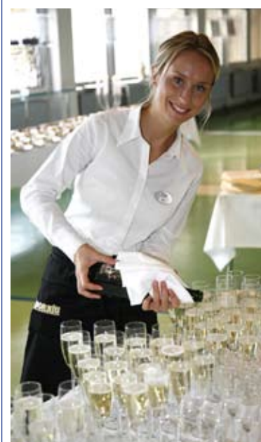
Fest Ullevi Lounge