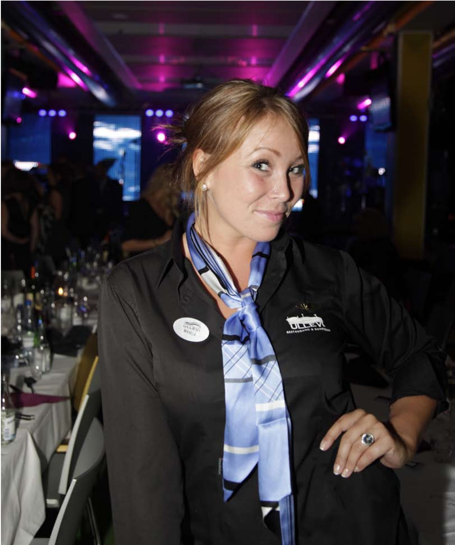
Värdinna Night Flight