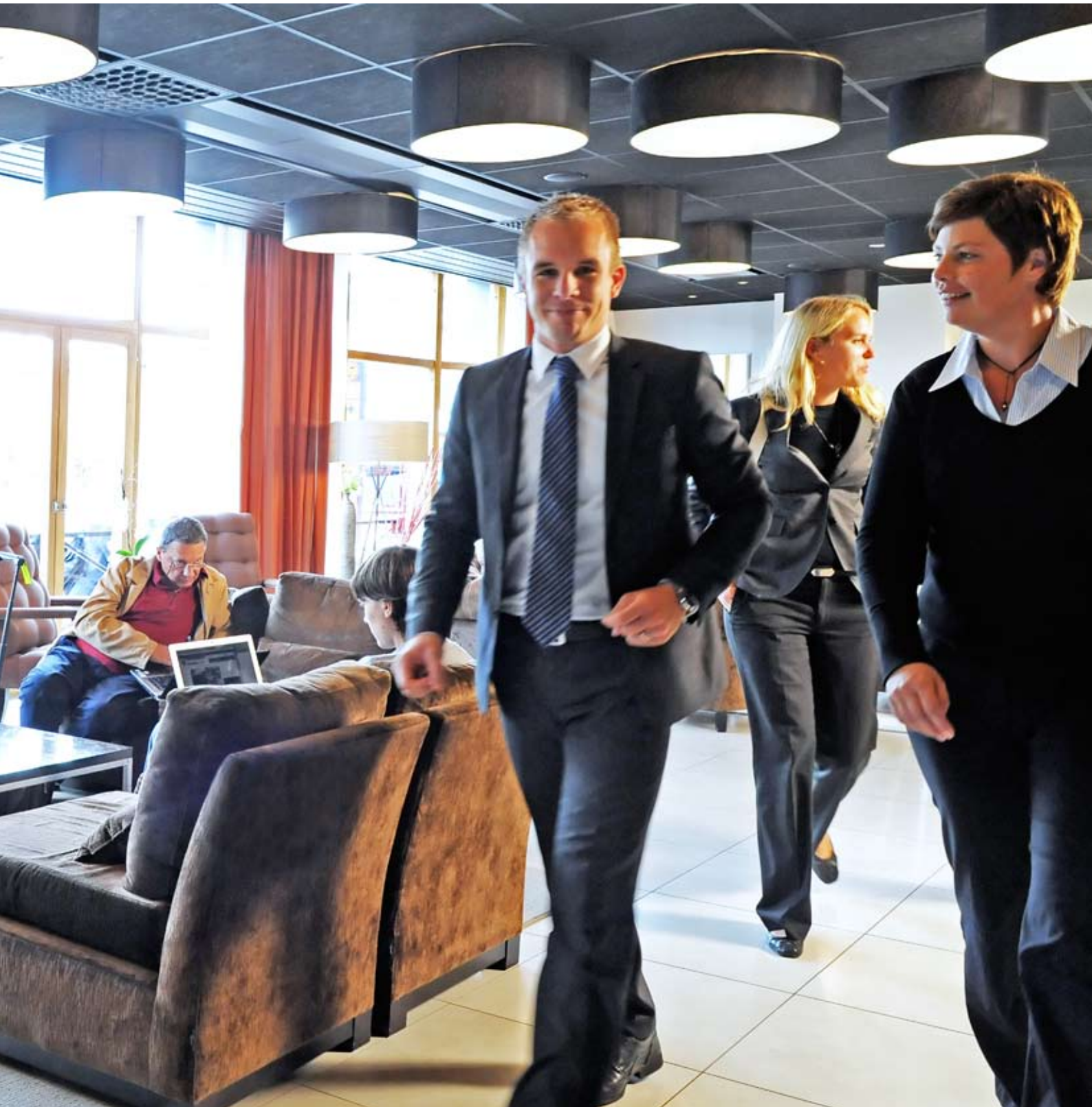
Lobby Grand Hotel Opera