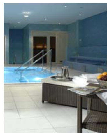
Spa Grand Hotel Opera