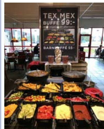
Tex Mex på Rasta