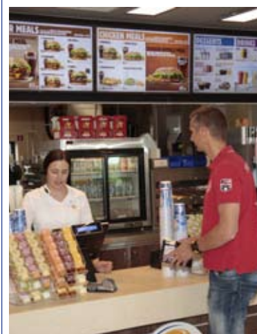
Rasta Burger King