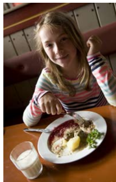
Lunch på Rasta Hagsta