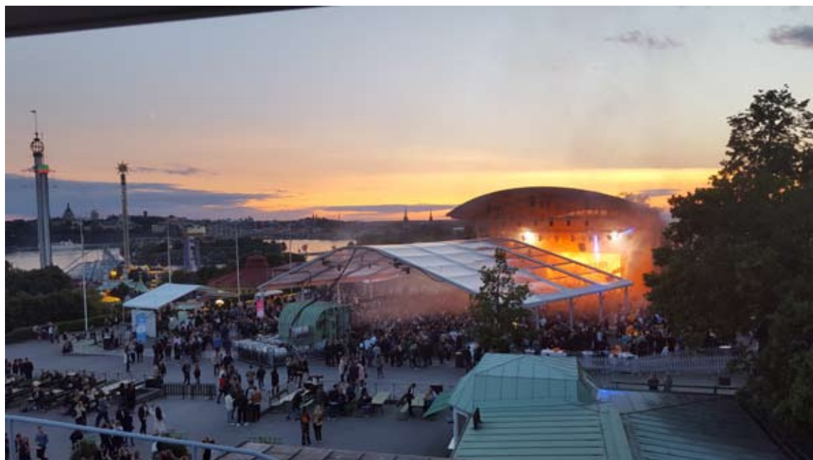
Out of office på Skansen

Kolumnen avstämning avser moderbolaget, koncernjusteringar, koncernelimineringar och transaktioner på bolagsnivå som inte ingår i själva rörelsesegmenten. Till största delen består kolumnen av omklassificering till finansiell lease.