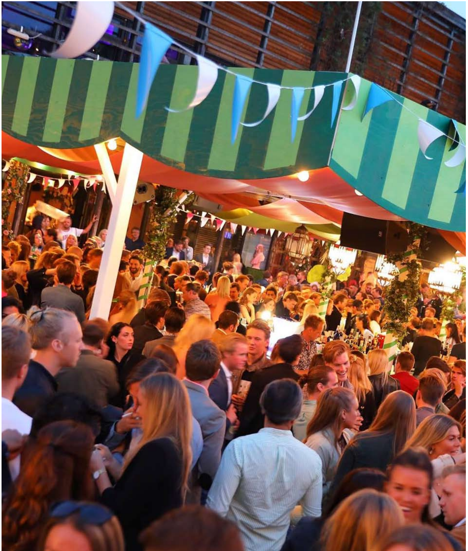
Premiär Port du Soleil på Trädgår'n i Göteborg