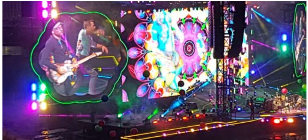
Coldplay på Ullevi