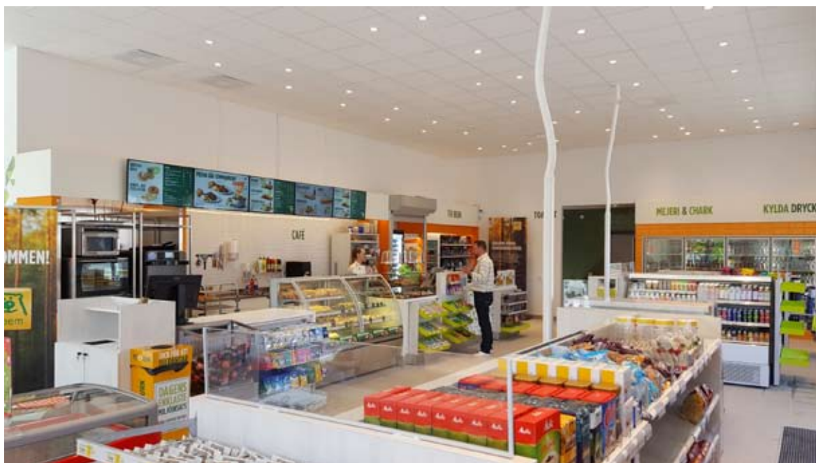
Servicebutik Rasta Markaryd

Kolumnen avstämning avser moderbolaget, koncernjusteringar, koncernelimineringar och transaktioner på bolagsnivå som inte ingår i själva rörelsesegmenten. Till största delen består kolumnen av omklassificering till finansiell lease.