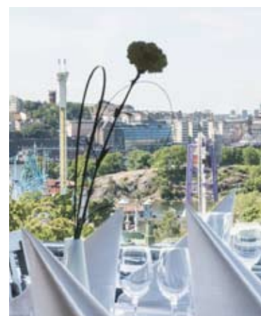
Utsikt från Solliden