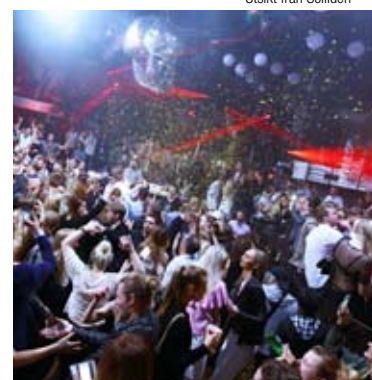
Port du Soleil på Trädgår'n