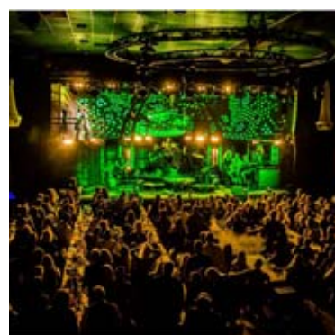
Rockshow på Trädgår'n