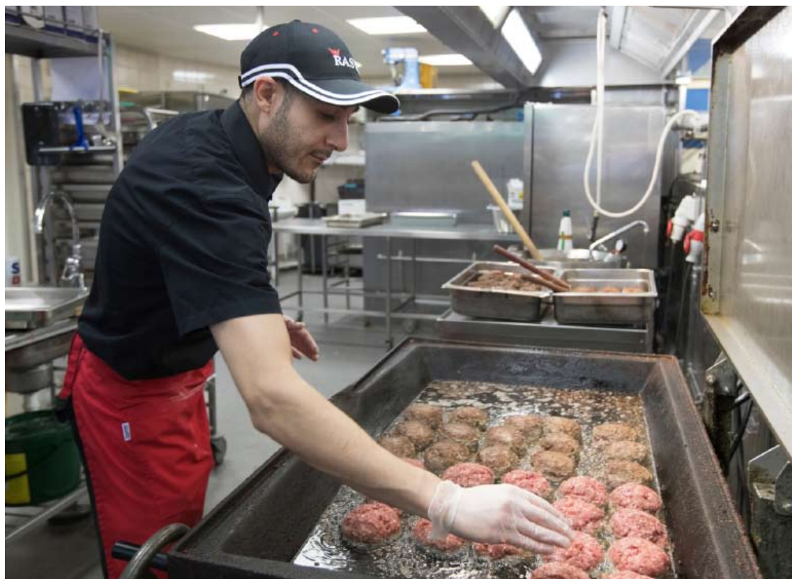
Pannbiff på Rasta Lilla Edet

Kolumnen avstämning avser moderbolaget, koncernjusteringar, koncernelimineringar och transaktioner på bolagsnivå som inte ingår i själva rörelsesegmenten. Till största delen består kolumnen av omklassificering till finansiell lease.