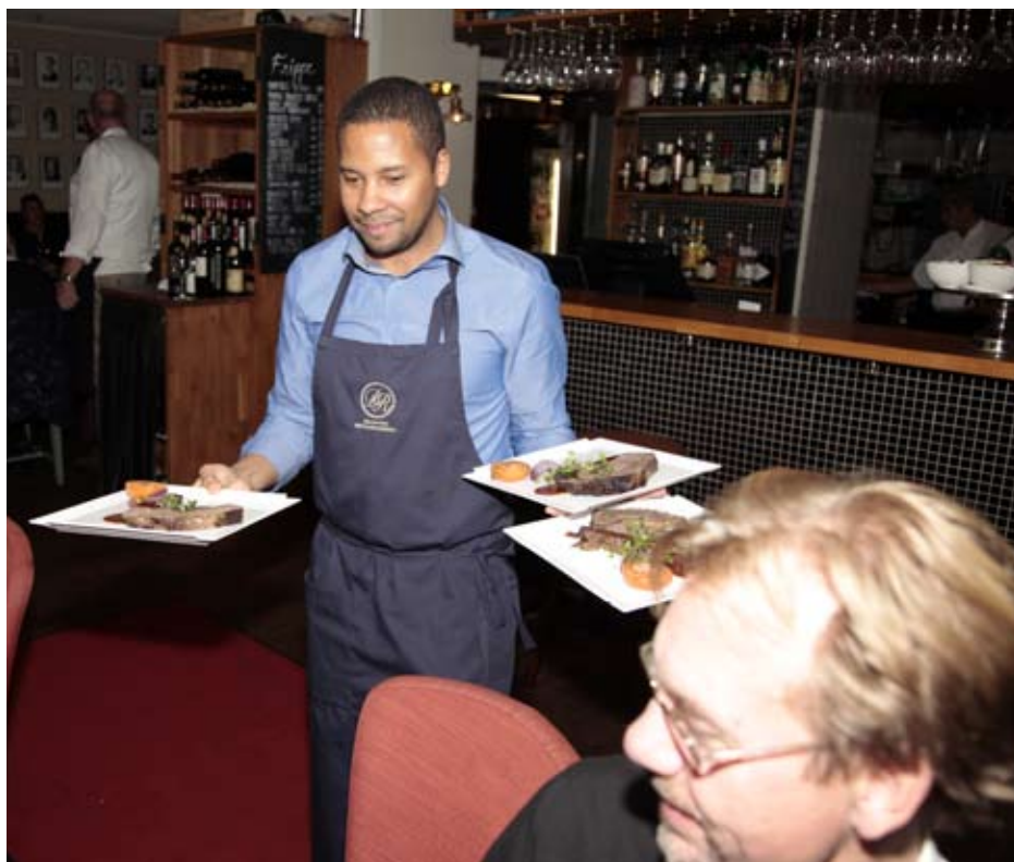
Restaurang Fripes, en del av Dramatens restauranger

Kolumnen avstämning avser moderbolaget, koncernjusteringar, koncernelimineringar och transaktioner på bolagsnivå som inte ingår i själva rörelsesegmenten. Till största delen består kolumnen av omklassificering till finansiell lease.