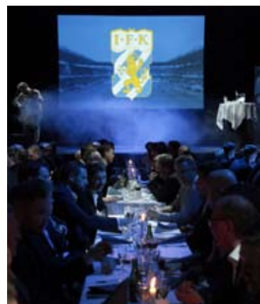
IFK Göteborgs kickoff på Trädgår'n