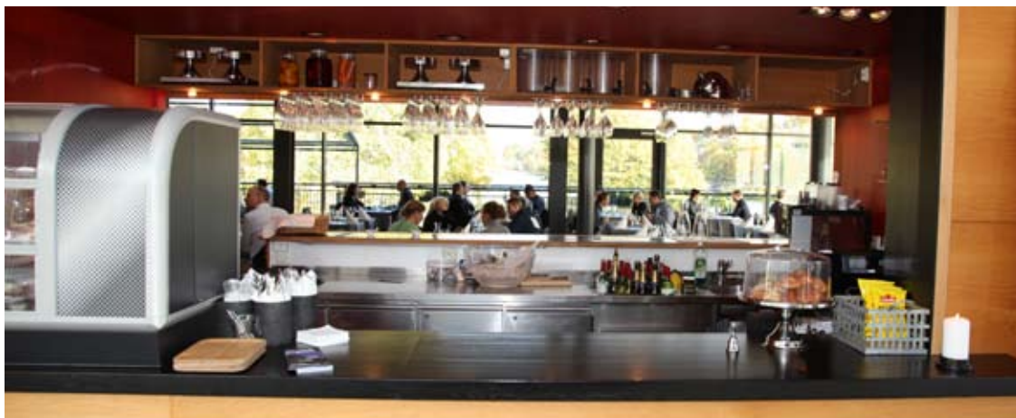
Rasta Kulturrestaurangens restaurang och konferensanläggning, Haga Forum