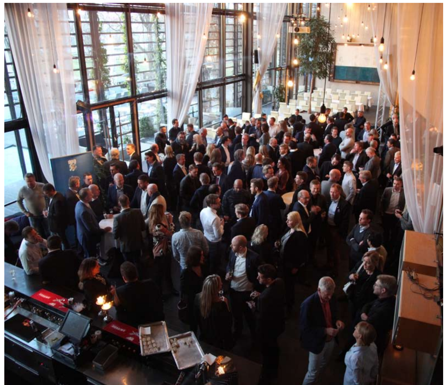
Mingel på Restaurang Trädgården