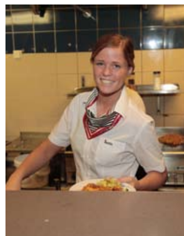
Servitris Rasta Brålanda