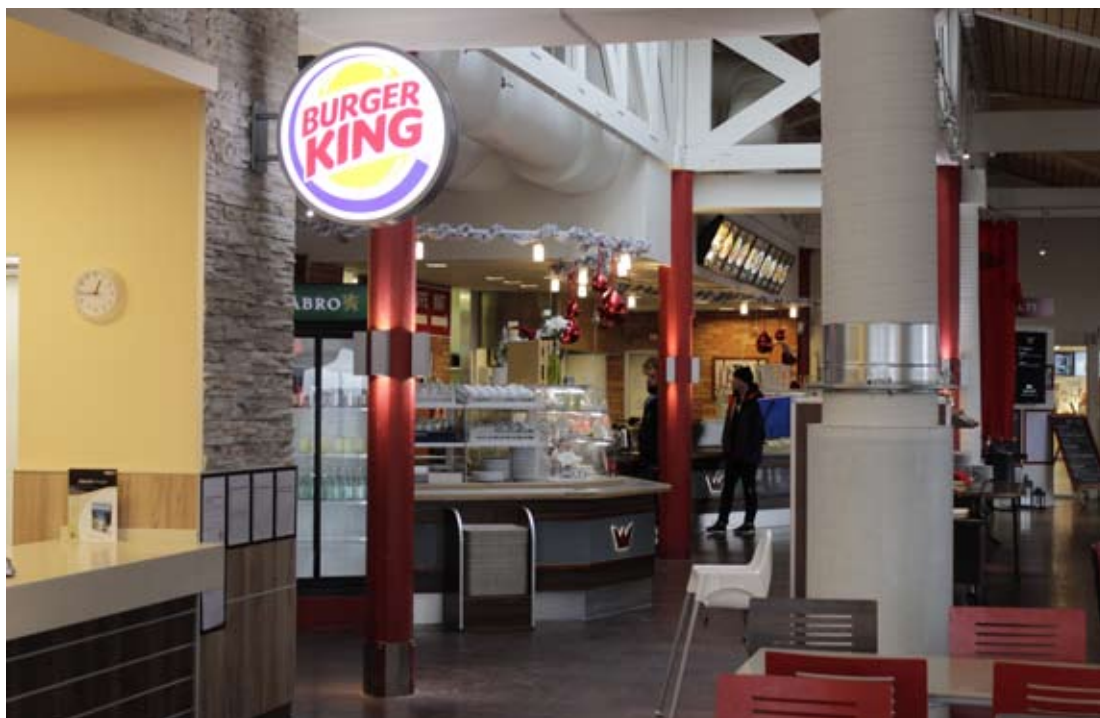
Rasta Göteborg, nu även med Burger King

Kolumnen avstämning avser moderbolaget, koncernjusteringar, koncernelimineringar och transaktioner på bolagsnivå som inte ingår i själva rörelsesegmenten. Till största delen består kolumnen av omklassificering till finansiell lease.