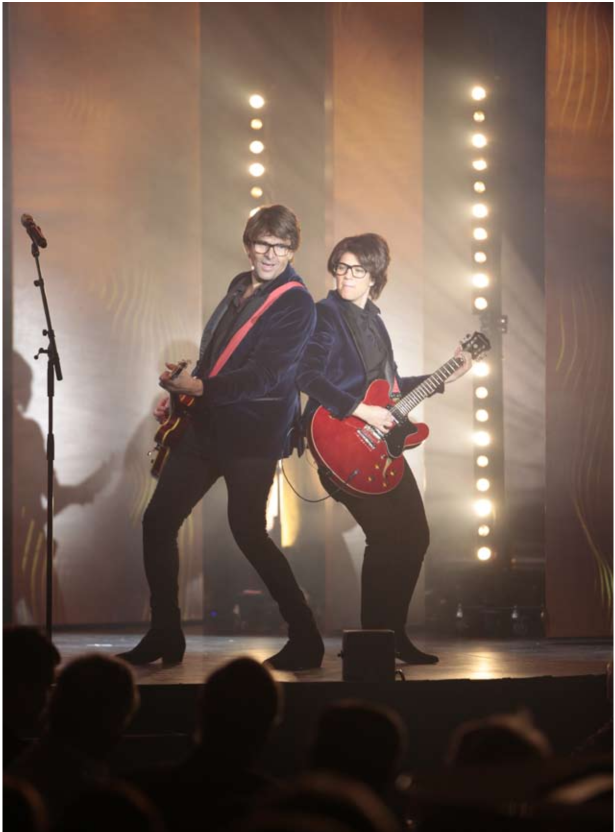
Niklas Strömstedts show på Trädgår'n i Göteborg