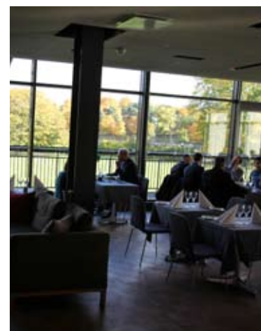
Lunch på Haga Forum