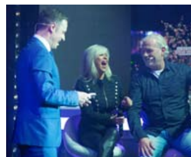
Glenn Hysén och Samantha Fox på Trädgården